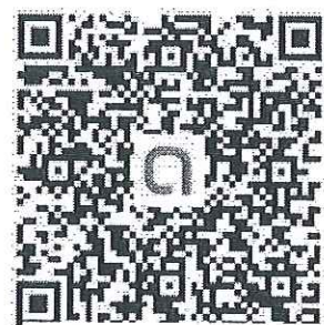
QR Code ครู ป.6