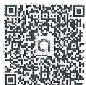
QR Code ครู ม.6