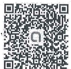
ครู อนุบาล 3