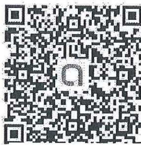
QR Code ครู ป.5