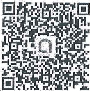
QR Code ครู ป.4