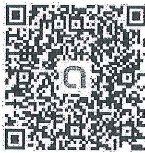
QR Code ครู ม.2