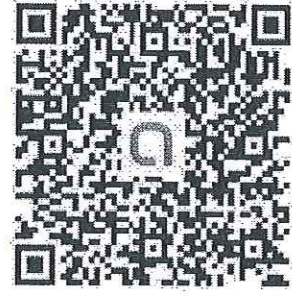
QR Code ครู ป.3