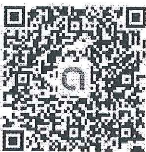
QR Code ครู ม.4