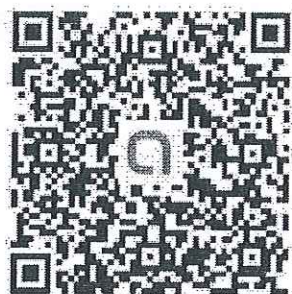
ครู อนุบาล 1