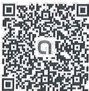
QR Code ครู อาชีว