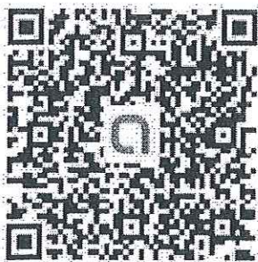
ครูปฐมวัย 2 ขวบ (อปท.)