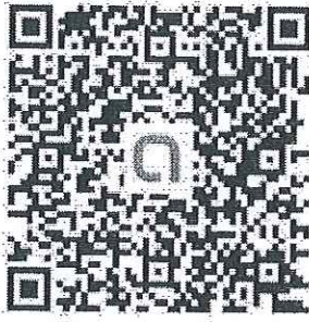
QR Code ครู ป.2