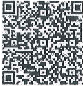
QR Code สมัครเป็นผู้ดูแลระบบ

1. QR Code สำหรับผู้สนใจสมัครเป็นผู้ดูแลระบบตามข้อ 1