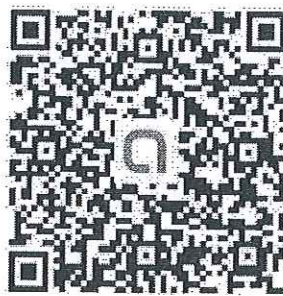
QR Code ครู ม.5