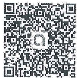
QR Code ครู ม.3