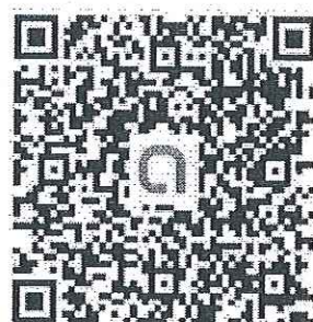
ครู อนุบาล 2