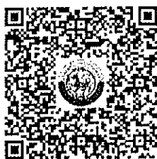
๑. QR Code แบบสำรวจ โรงเรียน/วิทยาลัย