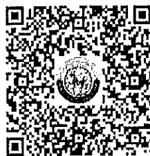
๒. QR Code แบบสำรวจ ศูนย์พัฒนาเด็กเล็ก