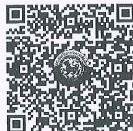
QR Code ๒ ตรวจสอบจำนวนผู้ชำระค่าลงทะเบียนแต่ละรุ่น