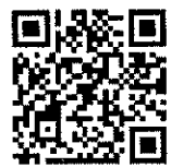
เอกสารแนบท้าย